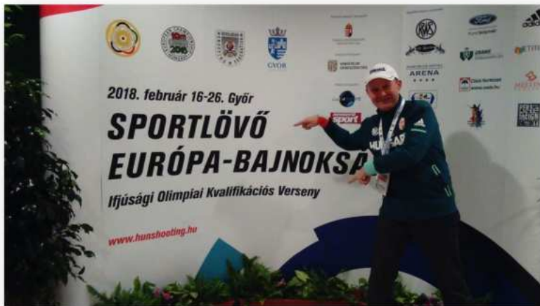
(2-3. fotó: A 2018-as Sportlövő Európa-bajnokság Ifjúsági Olimpiai Kvalifikációs Versenyén is sikeresen képviseltette magát a DLSE.)