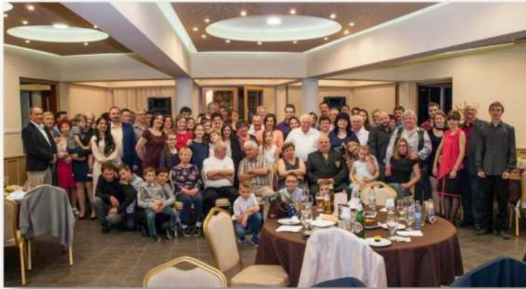
(36. fotó: A DLSE szervezésében valósult meg Debrecen XXI. századi történetében először Lovászbál, amit hagyományosan minden évben megtartanak 2011-től.)