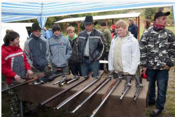
(31-32-33-34. fotó: Hadtörténelmi Napokon (Hajdúsági Hadismereti Napon pl.) is programokat adnak gyermektagjaiknak a DLSE szakemberei, az élményesemények homlokterébe természetesen a lövészetet állítva.)