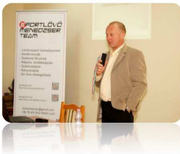
(8. fotó: A sportlövészet jó szakma hazai presztízsének és elismertségének, továbbá helyes megítélésének és összefogásának, fejlődésének elérését fókuszba emelő konferencián is képviseltette magát a DLSE, mint meghatározó egyesület.)