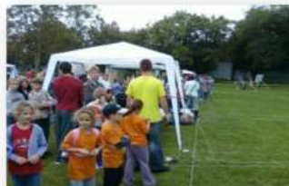
(26-27-28. fotó: Természetesen a Debreceni Nagy Sportágválasztó sportnapjain is mindig jelen van a gyermekek sportra nevelését szíven viselő DLSE.)