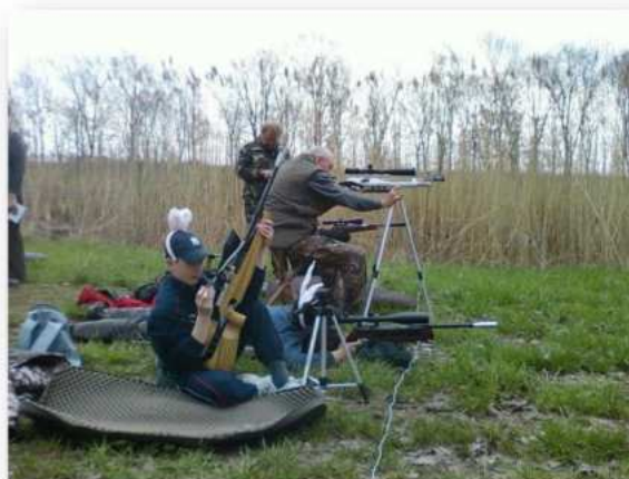
(23. fotó: Húsvétkor is sportlövészet, csak kicsit másképp, mókásan, oldottan, sok korosztályt bevonva: Forrás: Magánarchívum)