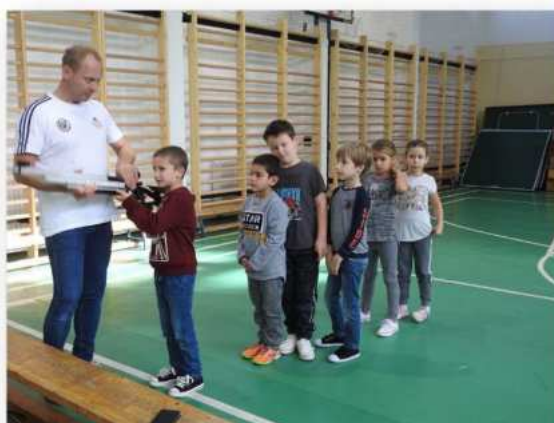
(10. fotó: Egy balmazújvárosi általános iskolában tart a DLSE egy sportlövészetet az alsósok körében népszerűsítő, élményszerű foglalkozást.)