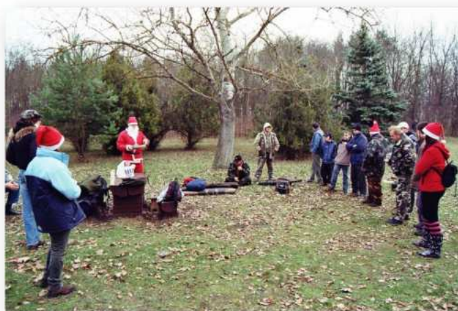
(29-30. fotó: Téli-nyáron, megállás nélkül „lőnek” a DLSE tagjai.)