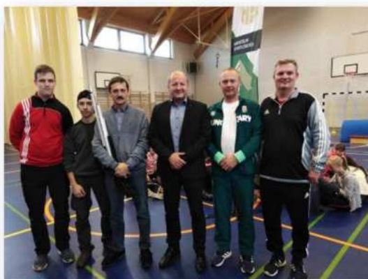
(9. fotó: A Mátészalkai Tankerület iskoláiban a Honvédelmi Sportszövetség által támogatott iskolai népszerűsítő megmozduláson szerepelt az egyesület a versenyzőivel, ahol Simicskó István kormánybiztos is jelen volt, támogatását nyilvánítva.)