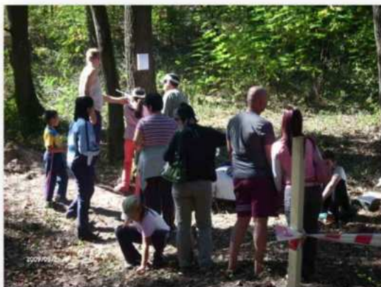
(22. fotó: Közös erdei túra, a csapatépítés, jó levegő, természetes életöröm jegyében, hiszen ezek mind-mind erősítik a sportlövészet örömezését és mentális kompetenciáit.)