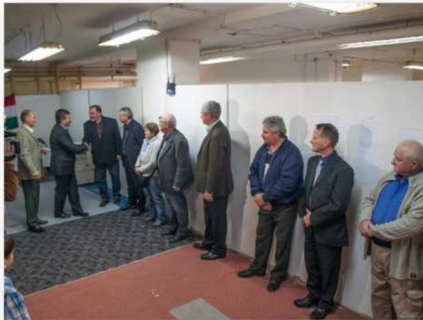
(37. A 2015 novemberi Domb utcai „lőteravató” eseményén készült fotó. A rangos eseményt Pajna Zoltán úr, a Megyei Közgyűlés elnöke is megtisztelte jelenlétével.)