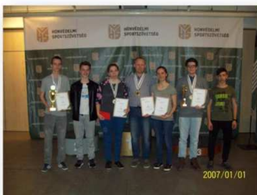
(19. fotó: A 2007. év eredményes versenyzőit megmutató büszke fotó.)