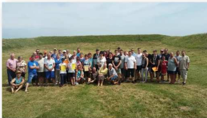
(35. fotó: A sport laikus lakossági részét is megmozgató esemény a DLSE szervezésében Derecskén 2018 júniusában.)