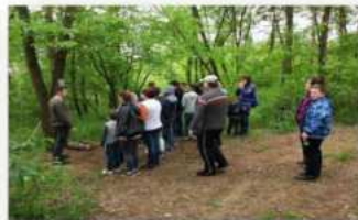
(24-25. fotó: Egy családi napon készült közös élményfotó a Bánki Arborétumból.)